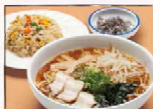
ラーメンセット 850円