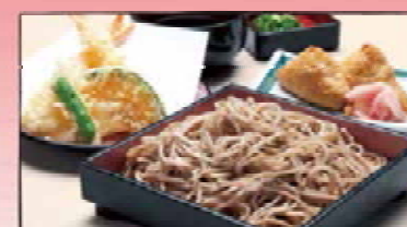
天ざるそばセット 1,050円 お食事券+200円