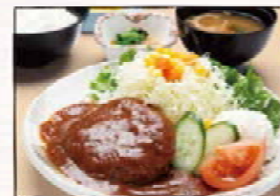
煮込みハンバーグ定食 850円