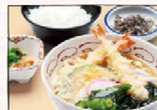
天ぷらうどんセット 850円