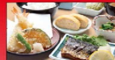
和定食 1,050円 お食事券+200円