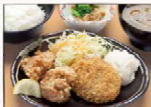
カラ・コロ定食 700円 鶏唐揚げ・牛肉コロッケ

名物 くずは盛り 800円 サラダ付き くずのとろみと大葉がアクセントの 和風だしカツカレーライス