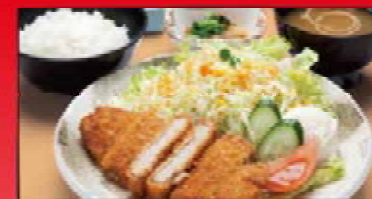
神戸ボーク使用 袖上とんかつ定食 1,350円 お食事券+500円